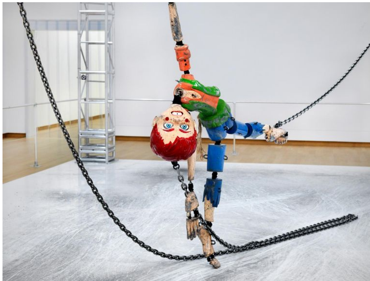
De sculptuur Manic/Love van Jordan Wolfson is in zijn beweging wat angstaanjagend