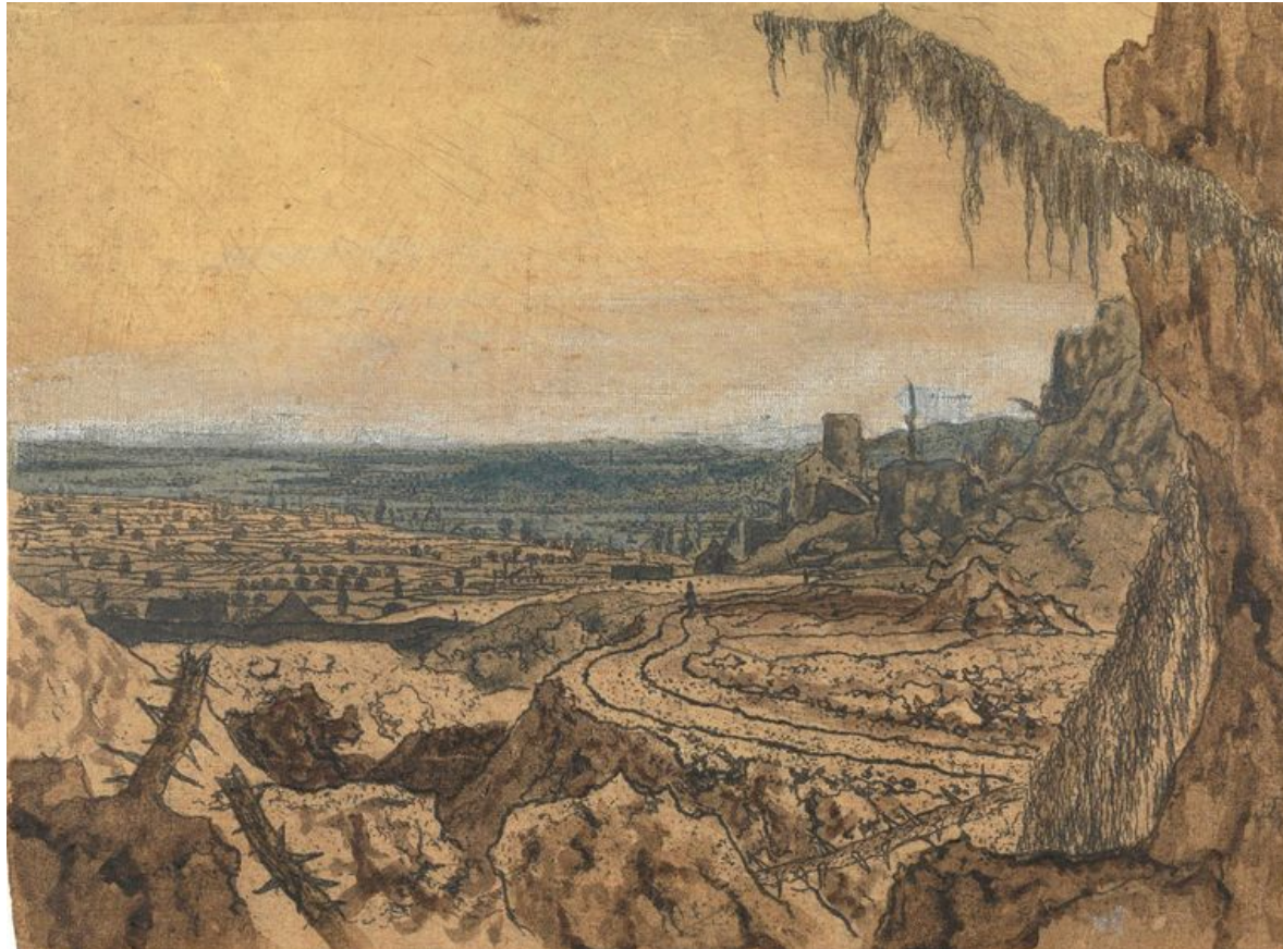
Vergezicht met een weg en bemoste takken BEELD HERCULES SEGERS